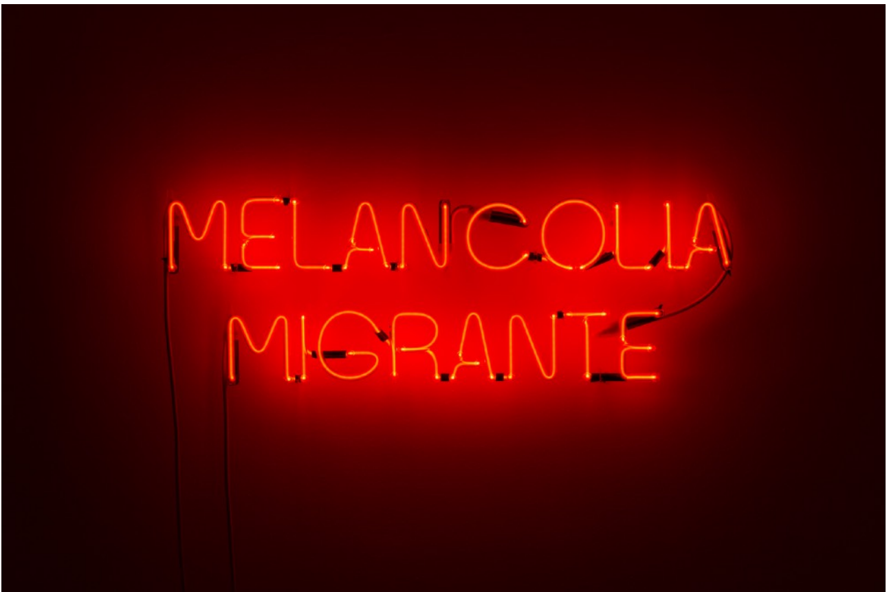
Melancolía Migrante Neón 80 x 35 cm 2018