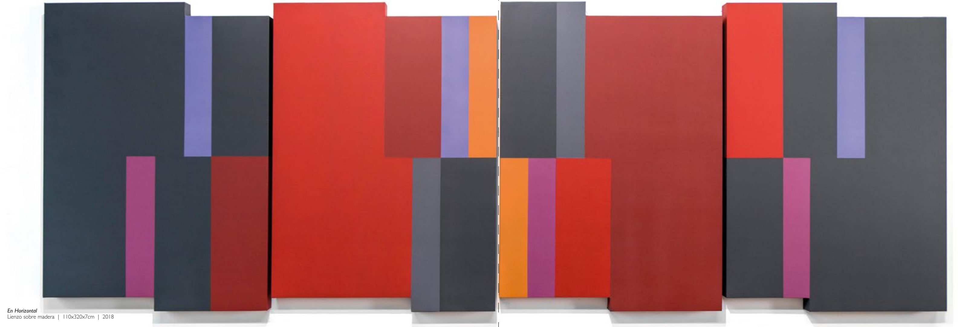
En Horizontal Lienzo sobre madera | 110x320x7cm | 2018