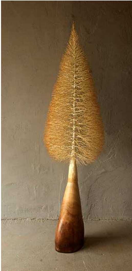
DANIEL R. MARTIN. Tusco abiegnis . 2018. Hierro madera patinados. 56 x 56 x 186 cm.