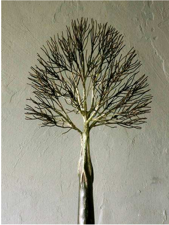
DANIEL R. MARTIN. Ligno sola hiems (detalle). 2018. Hierro patinado. 40 x 40 x 165 cm.

EXPOSICIÓN: DEL 25 DE MAYO AL 25 DE JUNIO DE 2018