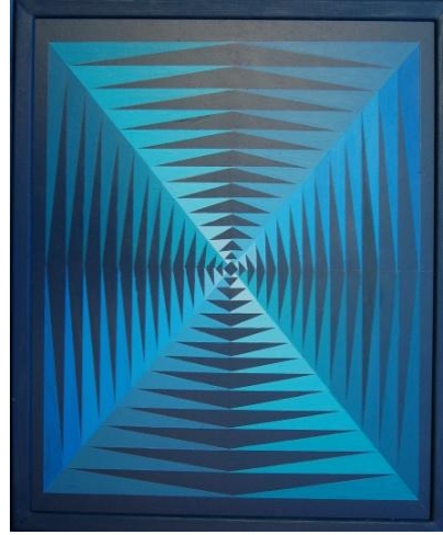
Sense títol. 2014