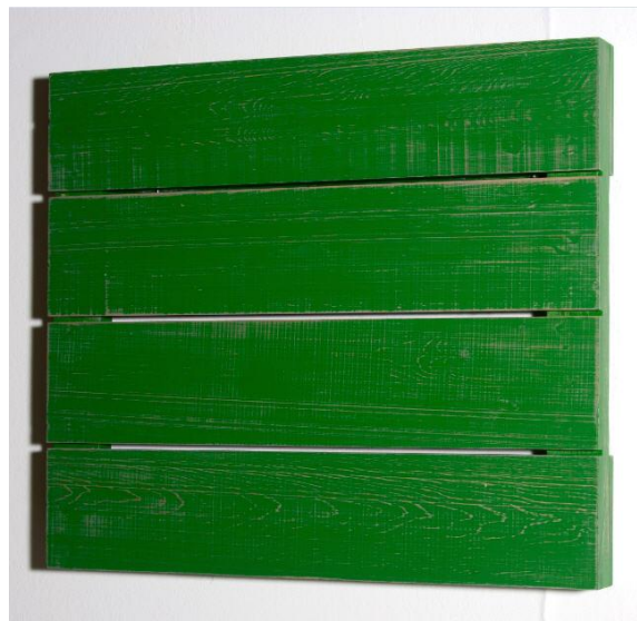
Madera pintada 13.2. 1983-2012

A mediados de los años setenta del siglo pasado comenzó haciendo una pintura realista y objetiva. Desde los años ochenta trabajó en la representación de estructuras, objetos y otros elementos del entorno urbano, hasta llegar sus obras a convertirse en objetos de naturaleza escultórica de gran rigor conceptual y compositivo.