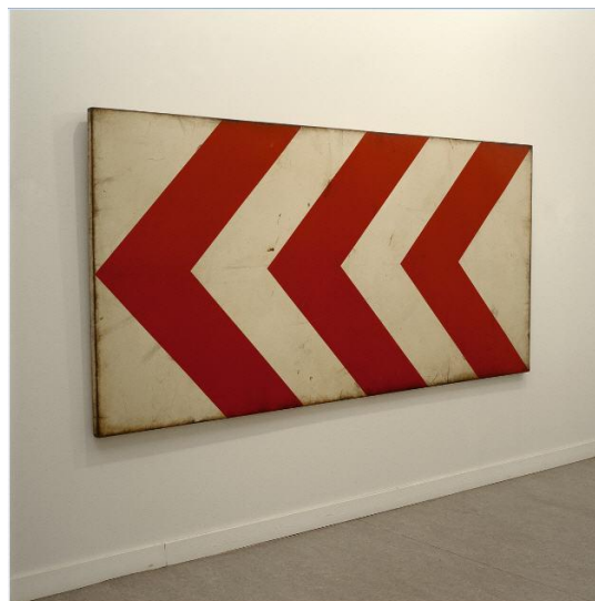
Dirección única. 1978 Pintura acrílica / tabla 90 x 190 x 2 cm.

Doctor en Bellas Artes, profesor de educación artística en la Universidad Complutense de Madrid, pintor y escultor de larga trayectoria, se le considera un artista imprescindible en el arte de nuestro país en las tres últimas décadas.