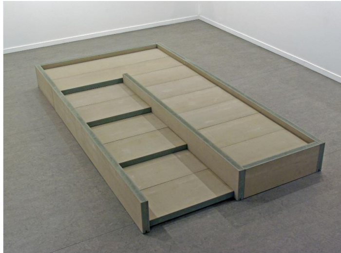
Estancia 17.4. 2009 Paneles sándwich de aglomerado cemento 30 x 180 x 332 cm.